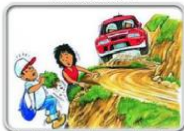
Ne stojite na mjestima bez mogućnosti uzmaka u hitnom slučaju.