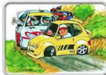
Budite oprezni dok vozite itinererom rallya.