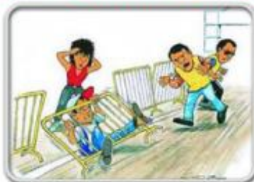
Ne ometajte organizatore u njihovom poslu. Ako možete, pomozite im.