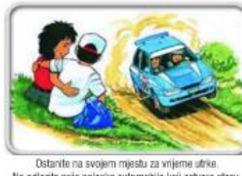
Ostanite na svojem mjestu za vrijeme utrka. Ne odlazite prije polaska automobila koji zatvara stazu.