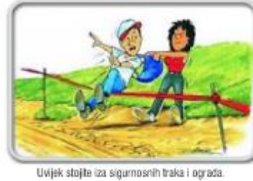
Uvijek stojite iza sigurnosnih traka i ograda.