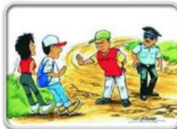
Ne približavajte se opasnim mjestima.