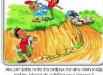
Ako primijete nešto što zahtjeva trenutnu intervenciju, molimo informirajte najbližeg suca sigurnosti.