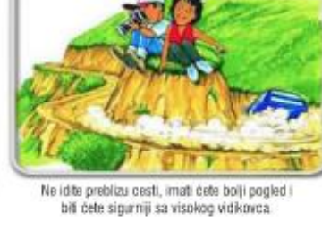
Ne idite preblizu cesti, imati ćete bolji pogled i bili ćete sigurniji sa visokog vidikovca.