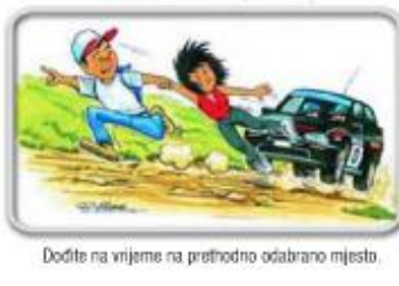
Dođite na vrijeme na prethodno odabrano mjesto.